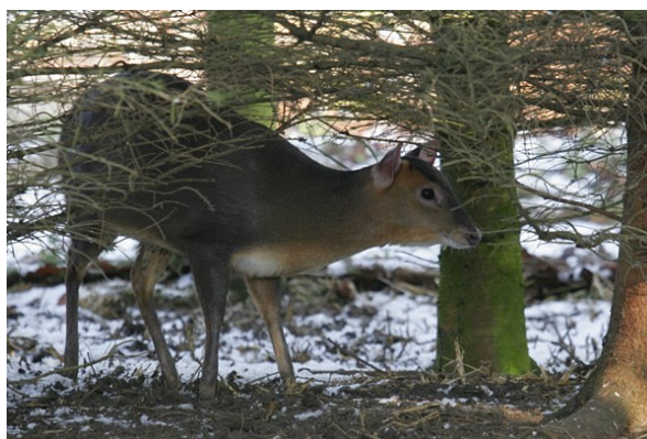
Obr. 5 Samice – zimní šat.

Rizika: Škody v lesích a zahradách způsobené okusem. Možnost kolize s automobily na silnicích.