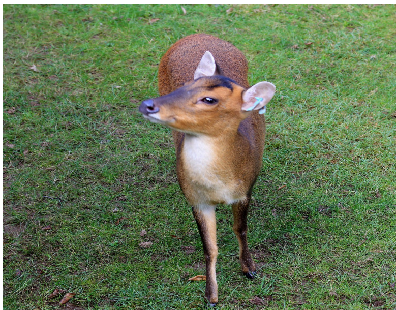
Obr. 1 Muntžak malý.