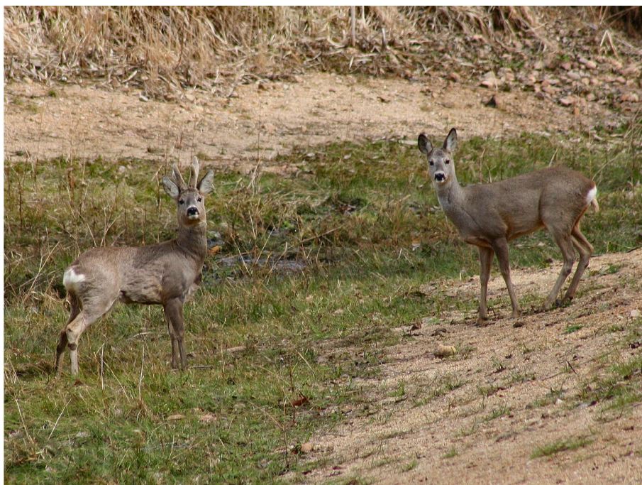
Obr. 7 Srnec obecný.

Likvidace: Odstřel, případně odchyt do pastí.