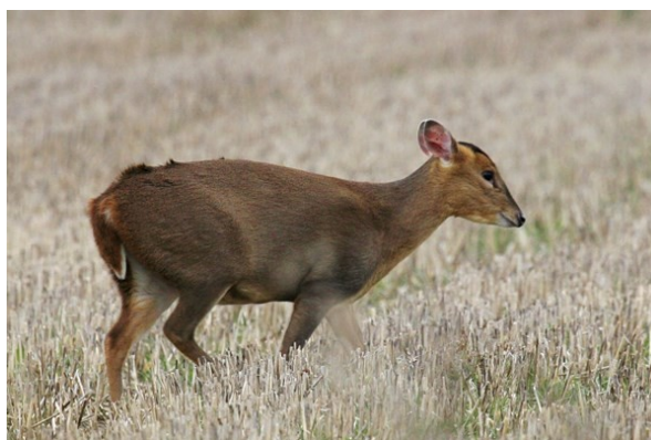
Obr. 4 Samice.

Živí se bylinami, listím keřů a stromů a pupeny. V zimě vyžaduje i potravu bohatou na bílkoviny a nerostné látky. Zřejmě by nepřežil kontinentální zimu. Vázaný na hustý podrost, ve kterém se nejčastěji pohybuje, zejména za soumraku. Jde o samotářské zvíře, jedinci se potkávají pouze v době rozmnožování. Říje probíhá v lednu a únoru. Březost trvá 7 měsíců a mládě váží při narození přibližně 1 kg. Je pokryto žlutavými skvrnami na kaštanovém pozadí. Rodí se vždy jediné mládě, které je kojeno čtvrt roku a drží se matky, dokud se nenarodí další. Samec se ozývá drsným, ostrým, helekavým štěkotem, pro který bývá také nazýván „štěkavý jelen“.