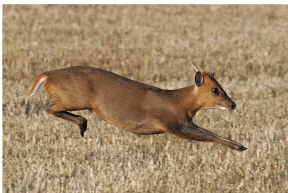
Obr. 3 Mladý samec.

Popis: Tělo je zhruba 70-90 cm dlouhé, výška v kohoutku přibližně 40-50 cm, ocas zhruba 12 cm. Dospělí samci váží kolem 15 kg, samice bývají cca o 3 kg lehčí. Samci mají jednoduché, většinou nevětvené parůžky cca 10 cm dlouhé, s nápadnými pučnicemi (8 – 10 cm). Také mají prodloužené horní špičáky (cca 2 cm), oproti samicím, u kterých dorůstají jen asi 0,5 cm. Mají krátkou, hladkou, hustou, leskle kaštanovou srst, samci bývají v oblasti hlavy a krku tmavší. Břicho je u mláďat světle šedé, s přibývajícím věkem šedne a tmavne. Podél přední strany pučnic jsou tmavohnědé pruhy (kresba tvaru V), vnitřní strana boltců, brada, hrdlo, zadní část břicha a vnitřní strana končetin, zadní část tváří a dolní strana ocasu jsou bílé. Zimní šat (od října do dubna) je tmavší než letní. Malé parůžky jsou shazovány v květnu nebo červnu a znova dorůstají v říjnu nebo listopadu. Při útěku vyniká bílé zrcátko pod ocasem.