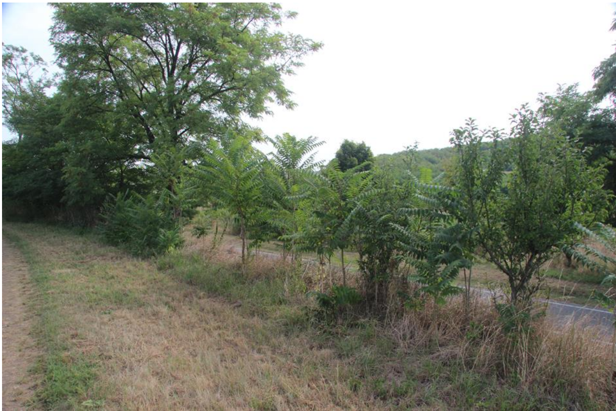
liniový porost pajasanu, střední hustota