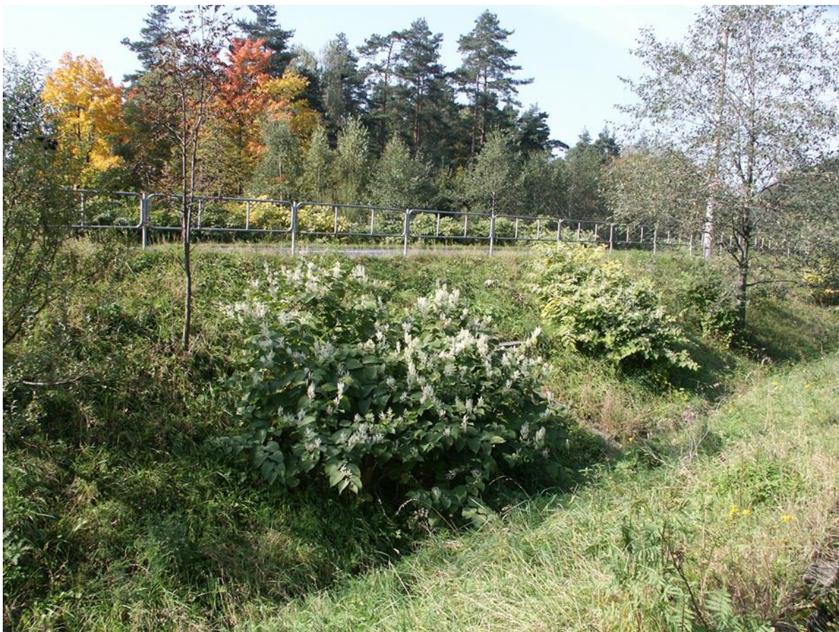
jednotlivé rostliny, příklad izolovaných a relativně malých polykormonů křídlatky