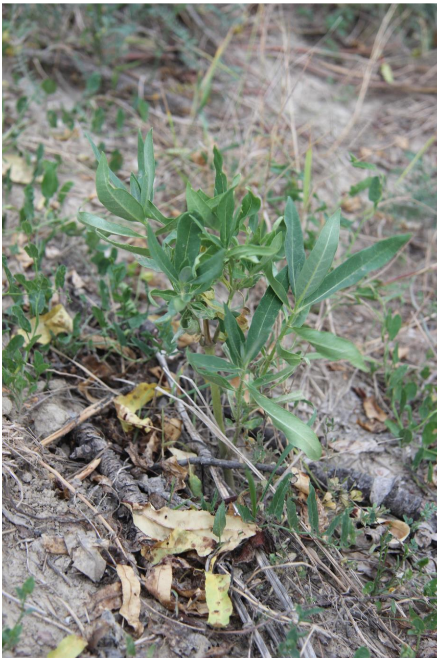
Regenerující jedinec klejichy po ošetření herbicidem. Ošetření je nutné opakovat a používat takové ředění herbicidu, které zlikviduje i pozemní kořenový/oddenkový systém.