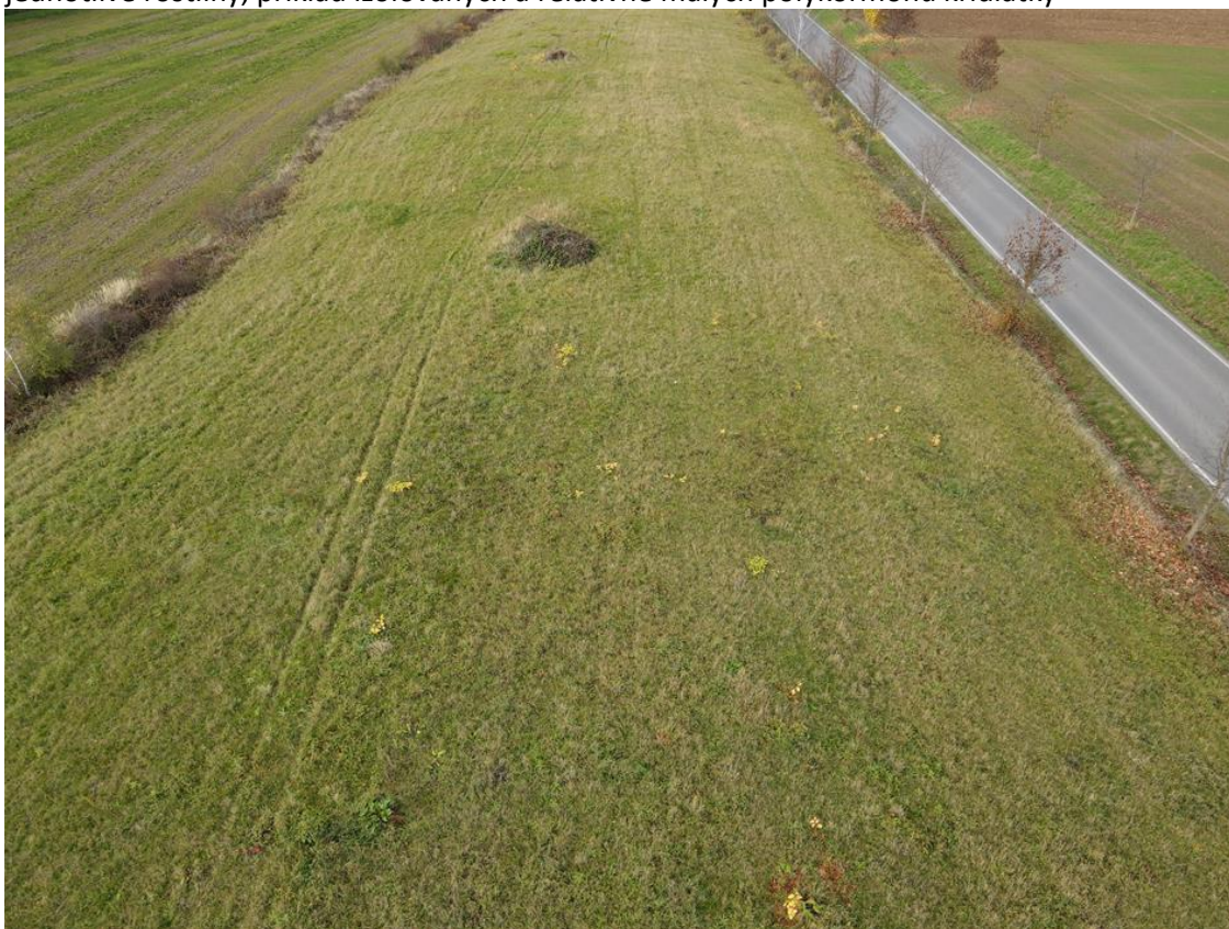
křídlatka rozetá na louce. nemá smysl zakreslovat jednotlivé výhony (ramety). příklad střední hustoty