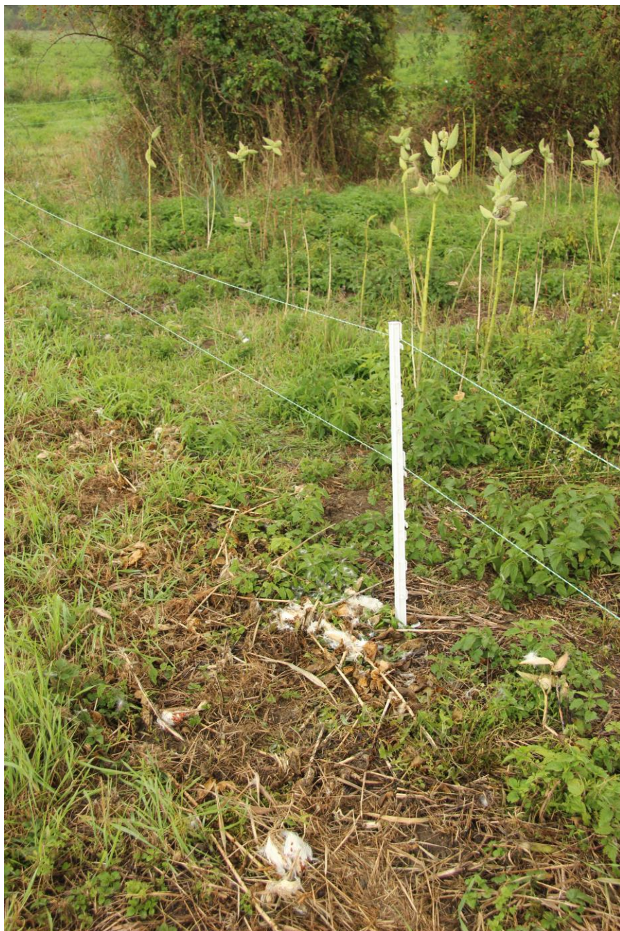
Pozdní zásah proti klejše s již vyvinutými semeny.