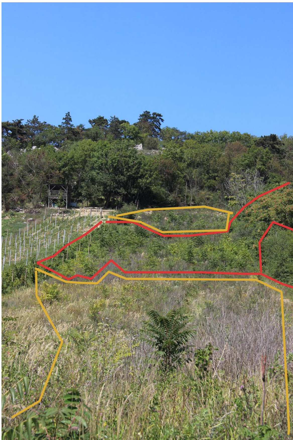
hustý porost ve střední části pozemku, v pozadí a v popředí středně hustý porost