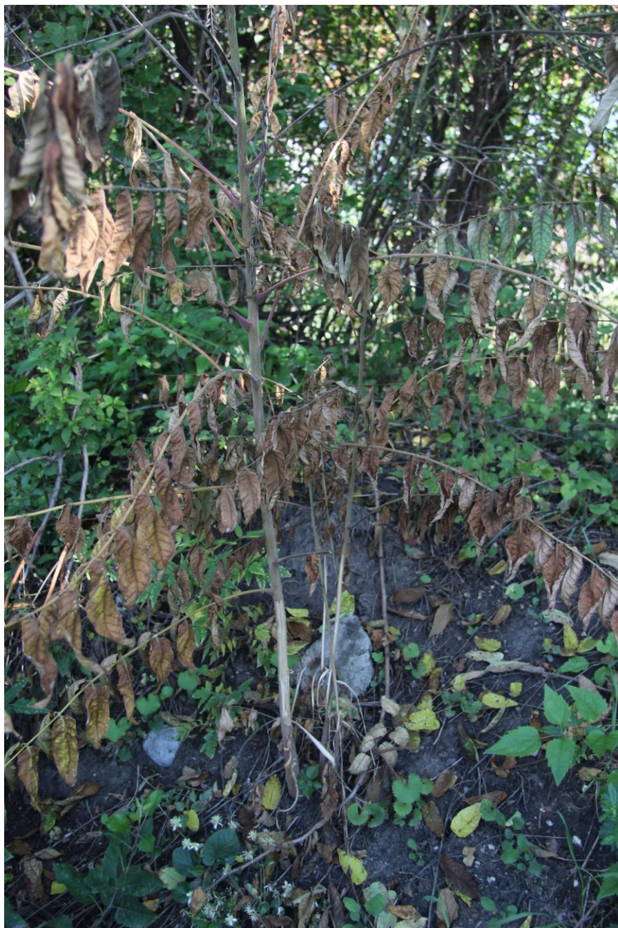
Detail ošetření mladých jedinců pajasanu s odstraněním části kůry a zatřením herbicidem.