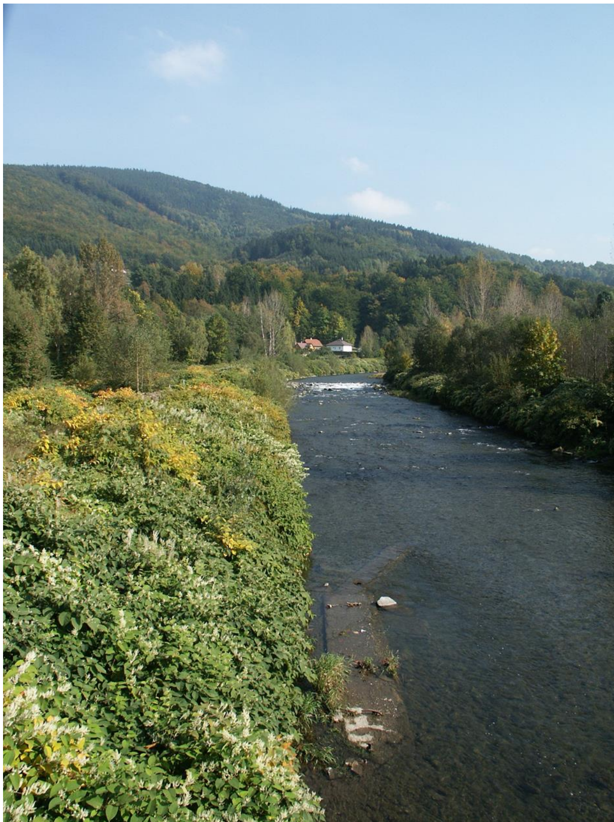
příklad velmi hustého porostu