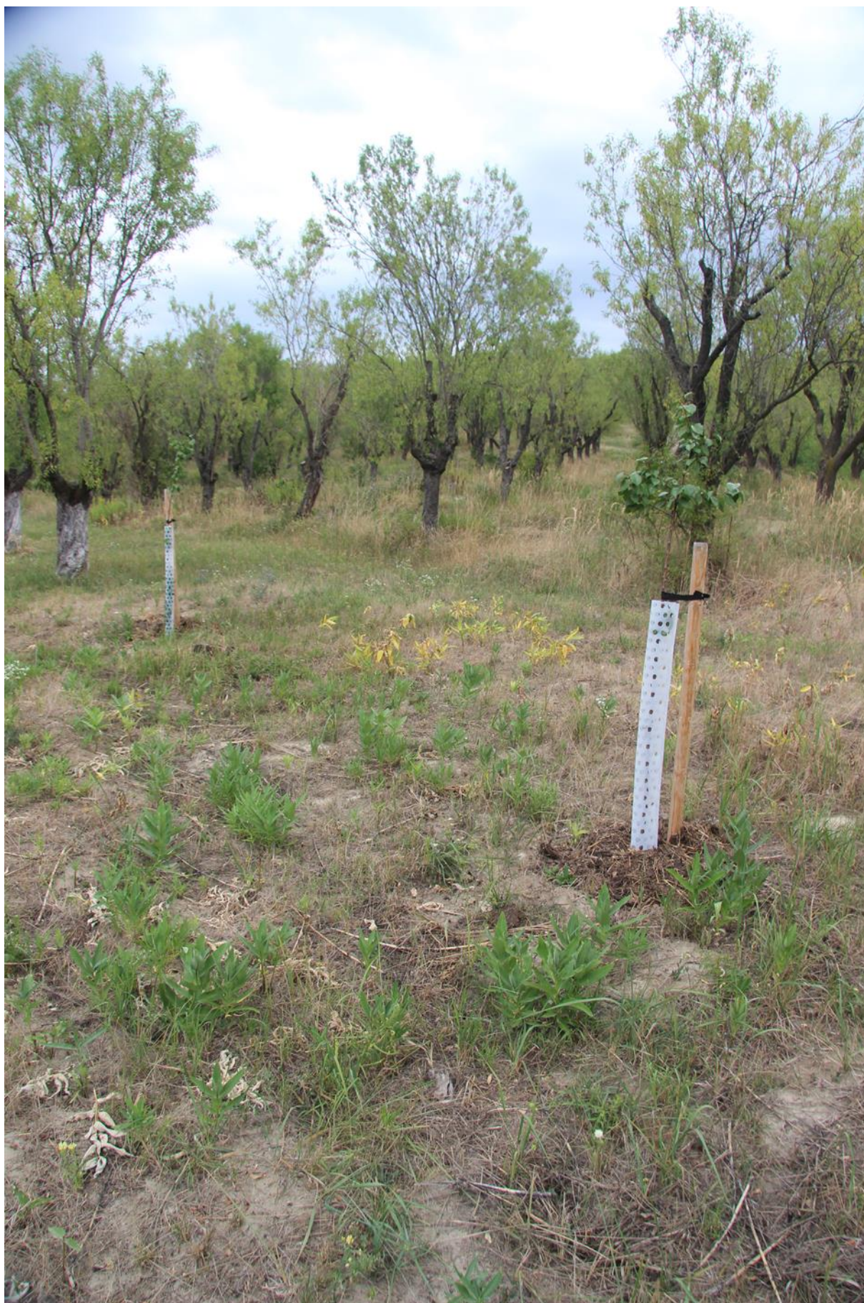
plocha po ošetření. střední hustota