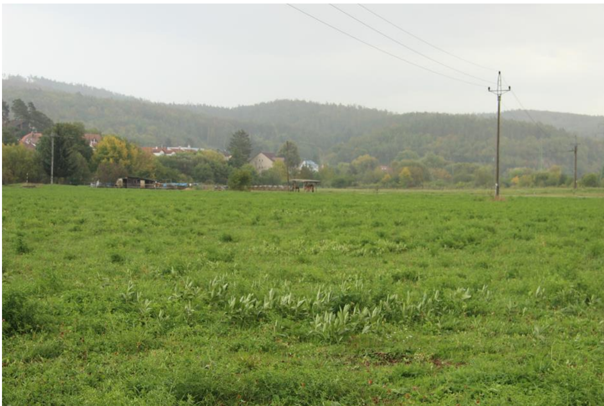
hustá pokrývnost na pastvině