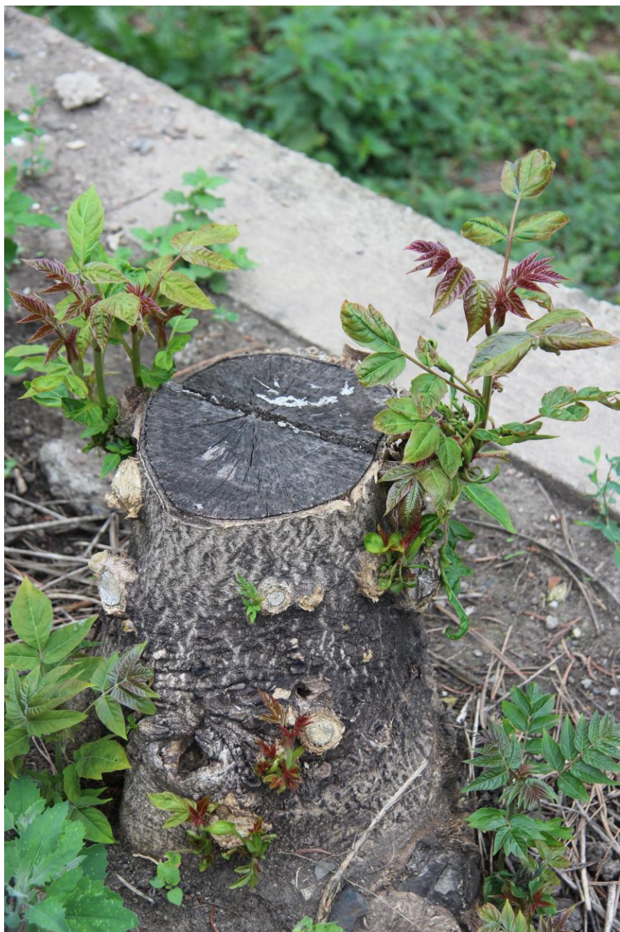
Nedostatečně ošetřený pařez pajasanu s regenerací na pařezu a kořenech.