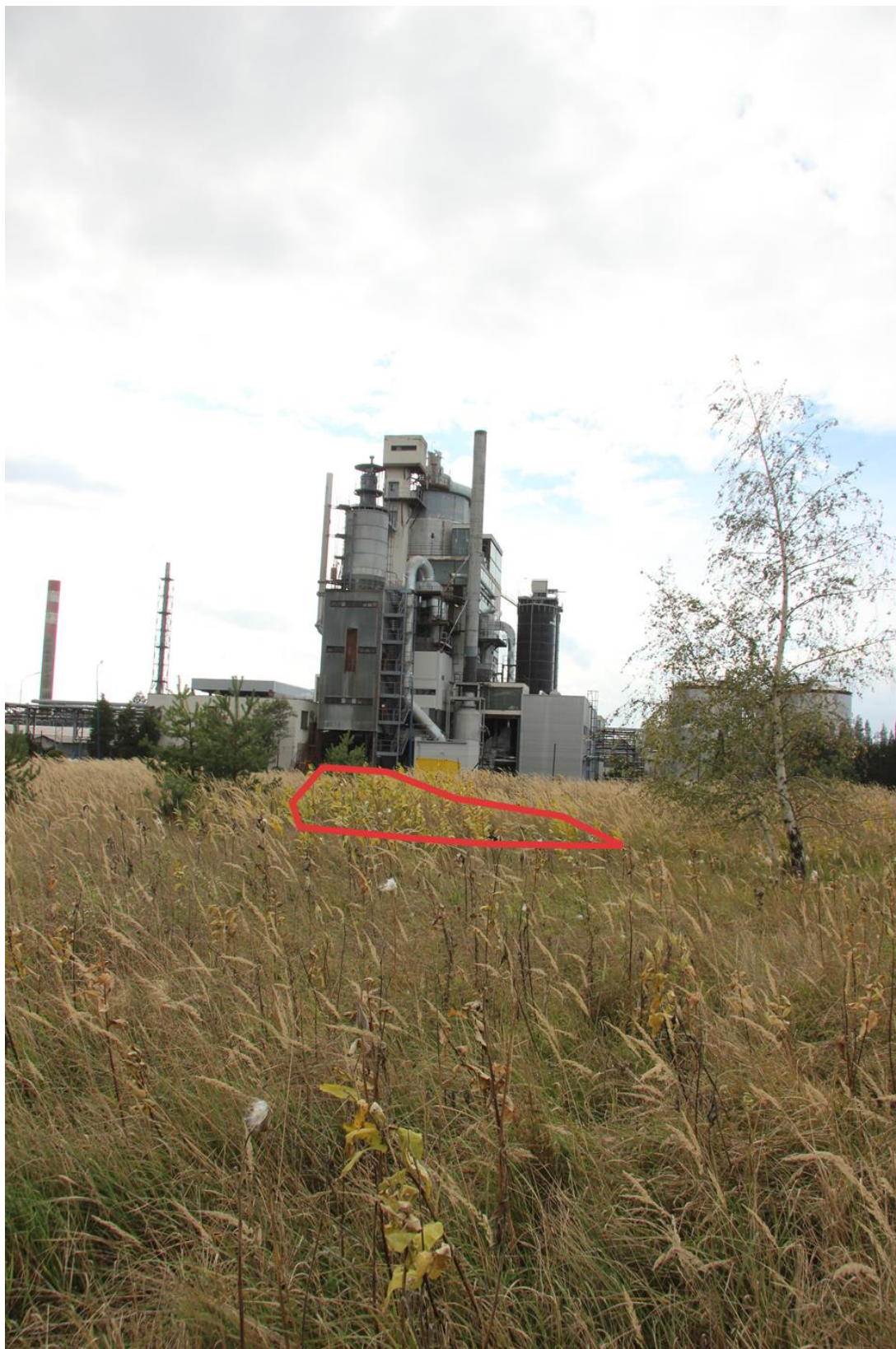
porost s kombinací střední a husté (červeně označené)