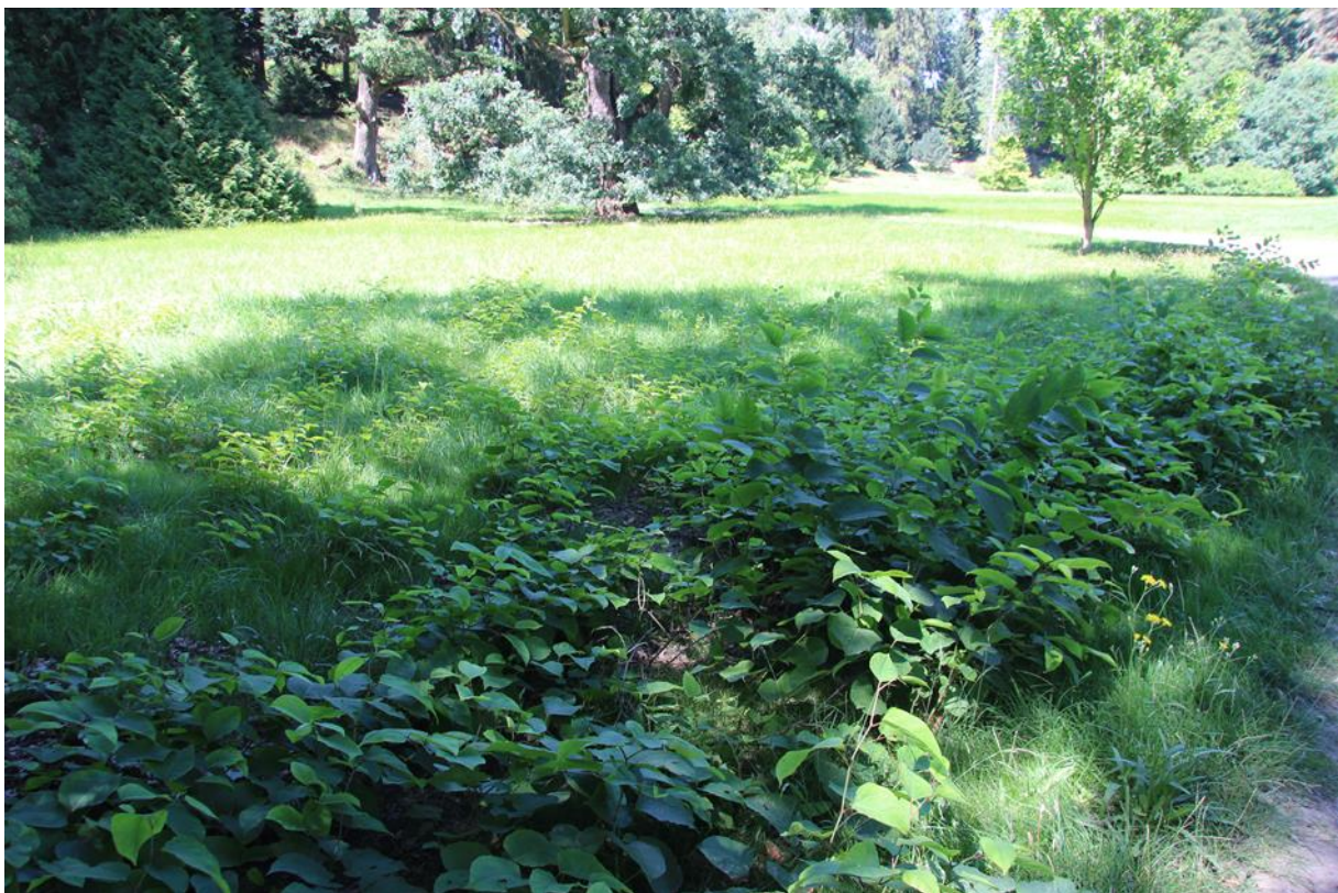
příklady hustých porostů. sekání značně ovlivňuje subjektivní vnímání hustoty