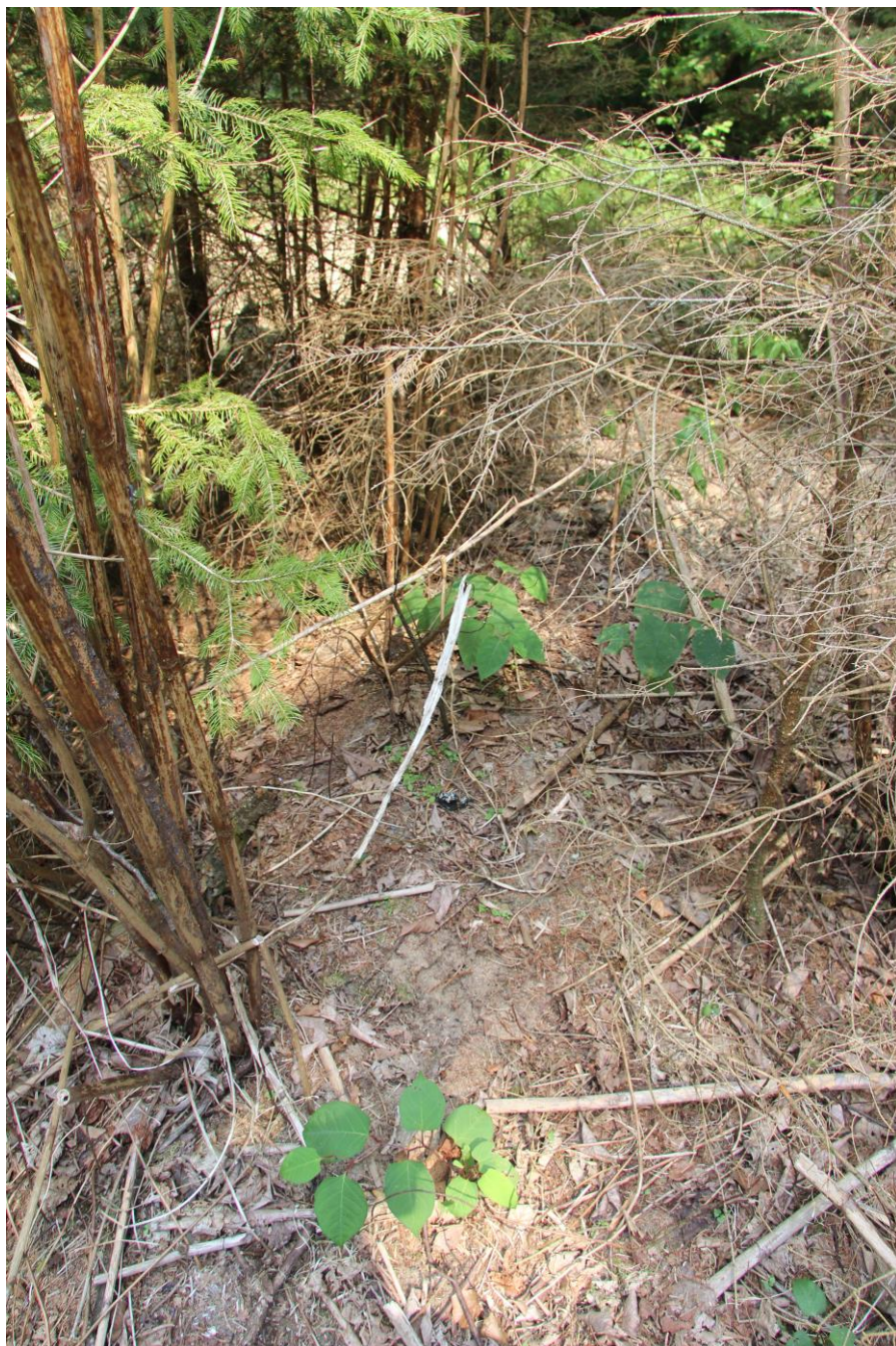
V ploše ošetřené herbicidem dochází k i přes správný postup k regeneraci. Regenerující výhonky je třeba ošetřit.