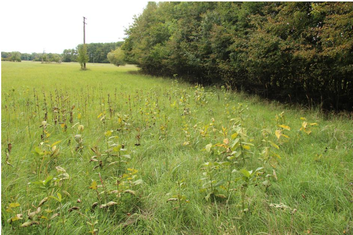
střední hustota klejichy