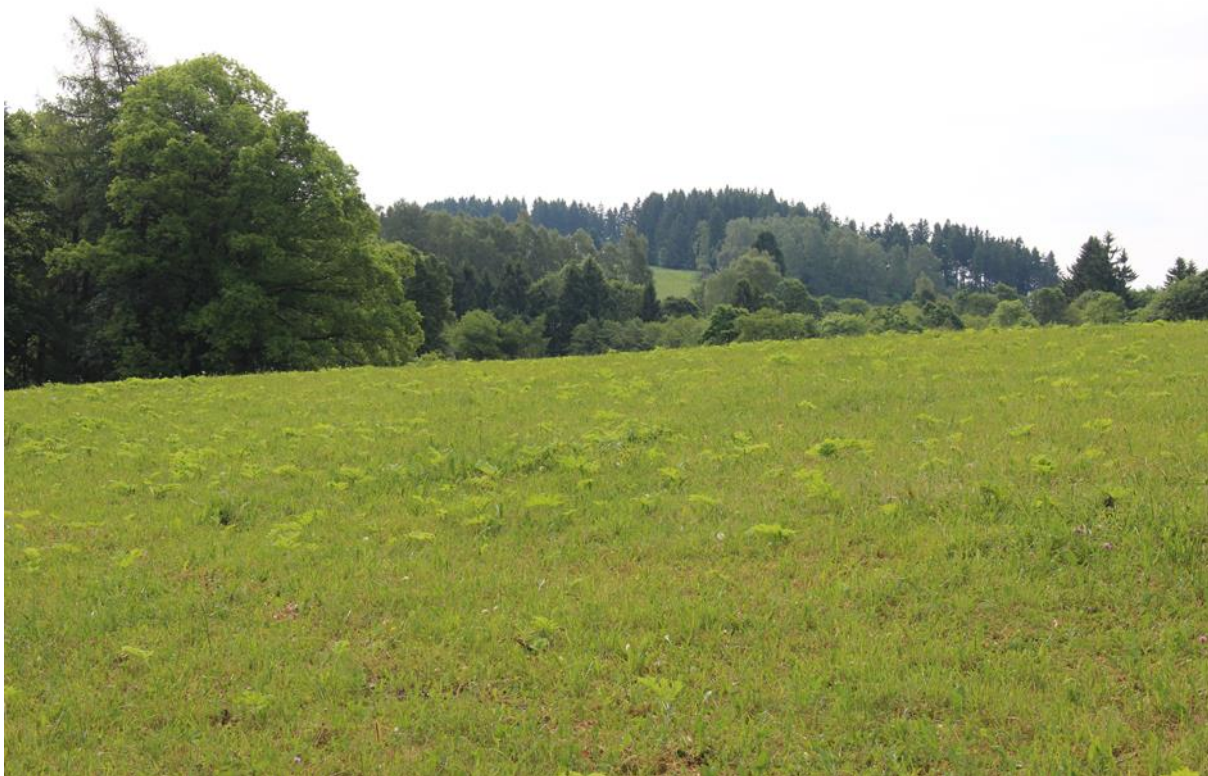
pokud na ploše nejsou ve velké míře semenáče, jedná se o střední pokryvnost