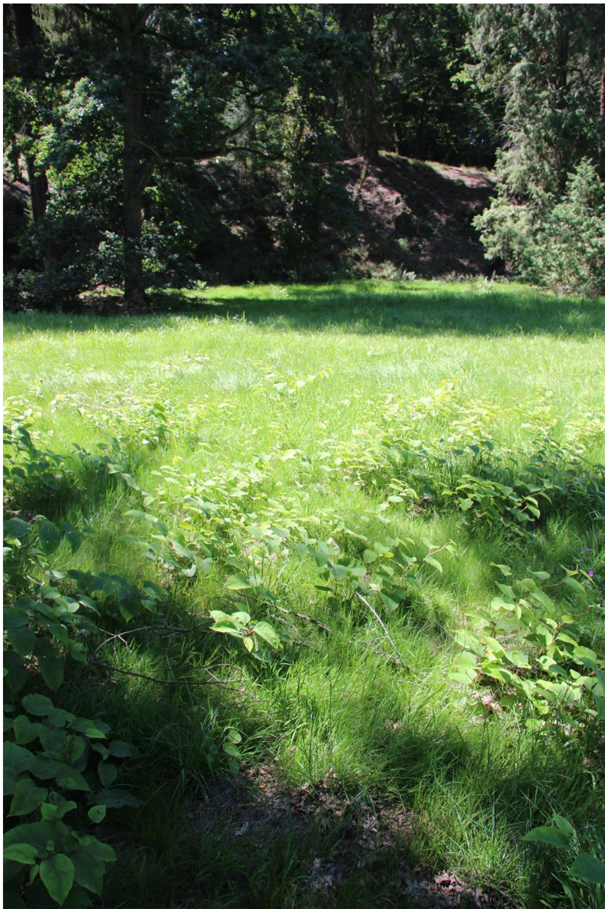
sekání značně ovlivňuje vnímání hustoty. zde se jedná o hustý porost