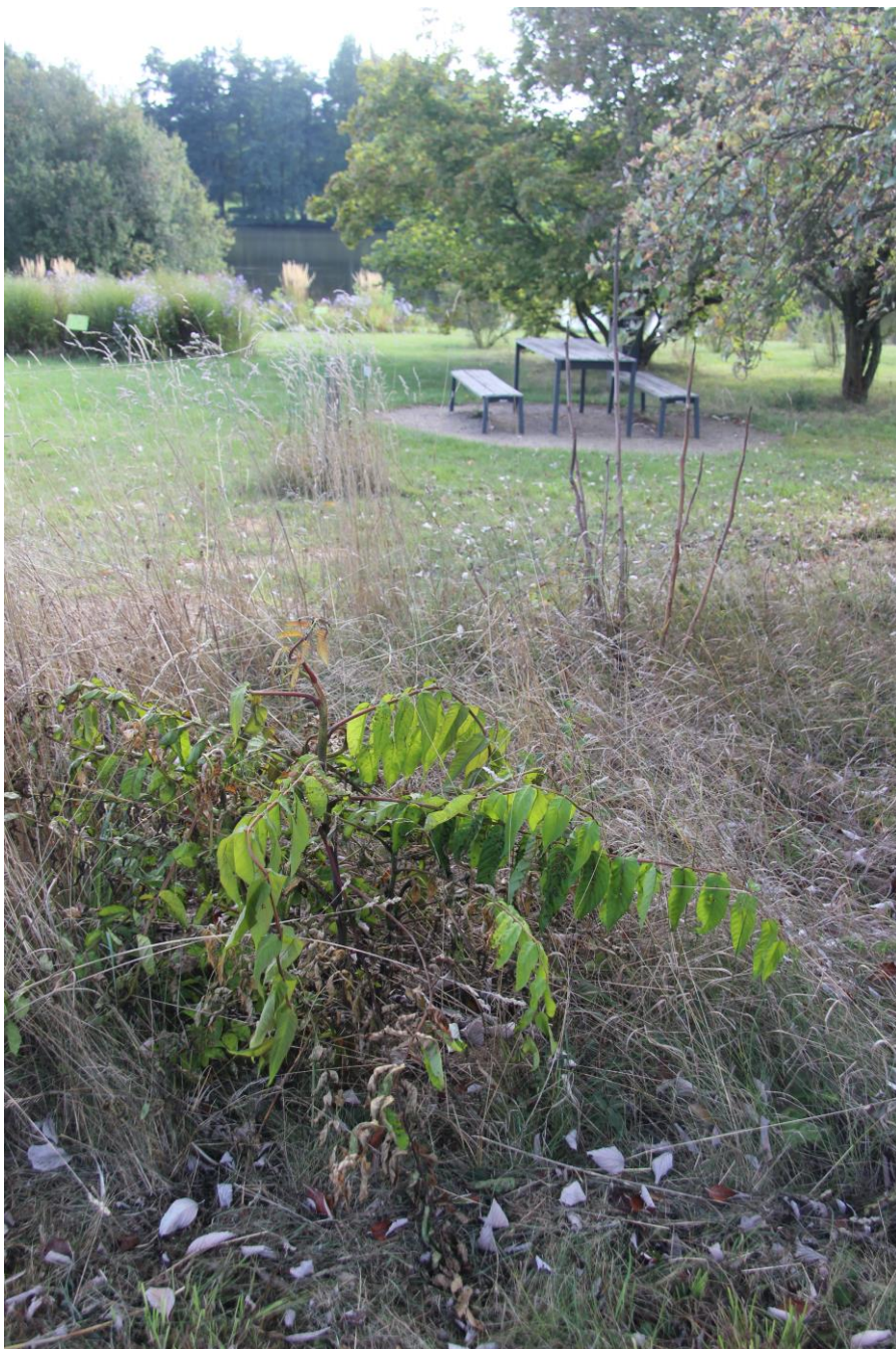
Ošetřený mladý jedinec postřikem. Jedná se o přístup možný, ale s riziky na okolí. Také účinnost nemusí být tak efektivní.