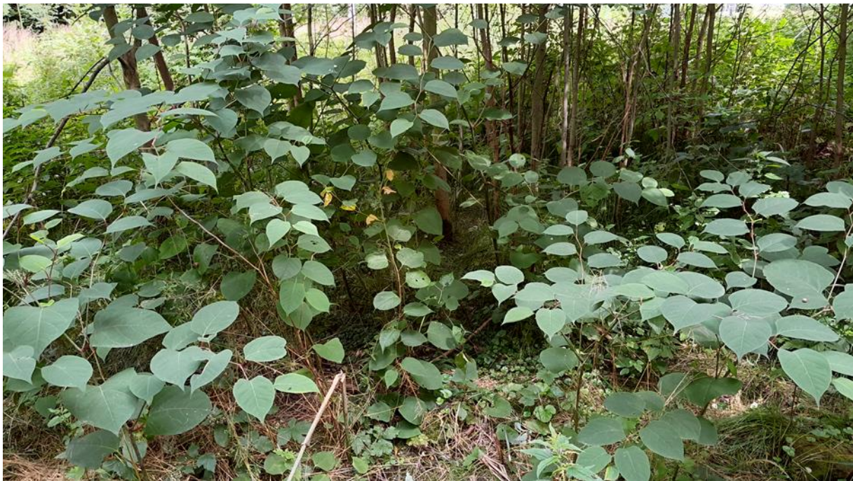
pohled do podrostu husté abundance