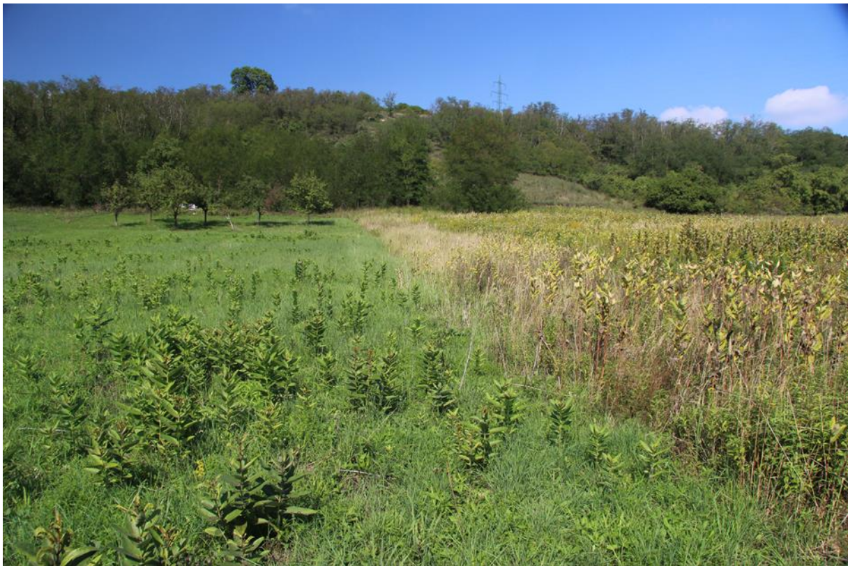
v levé části střední hustota, v pravé části hustý porost klejichy