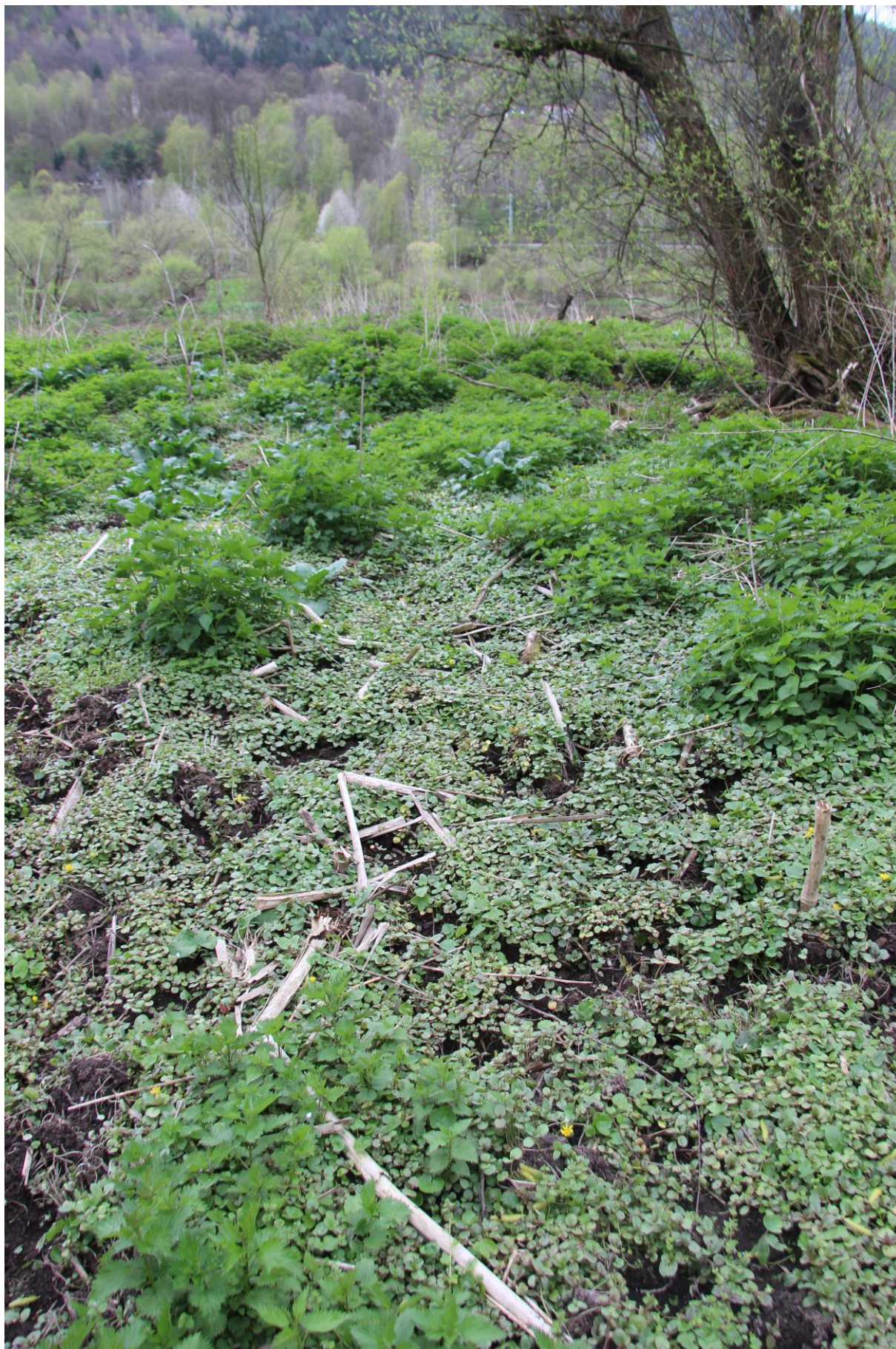
hustý porost (semenáče netýkavky)