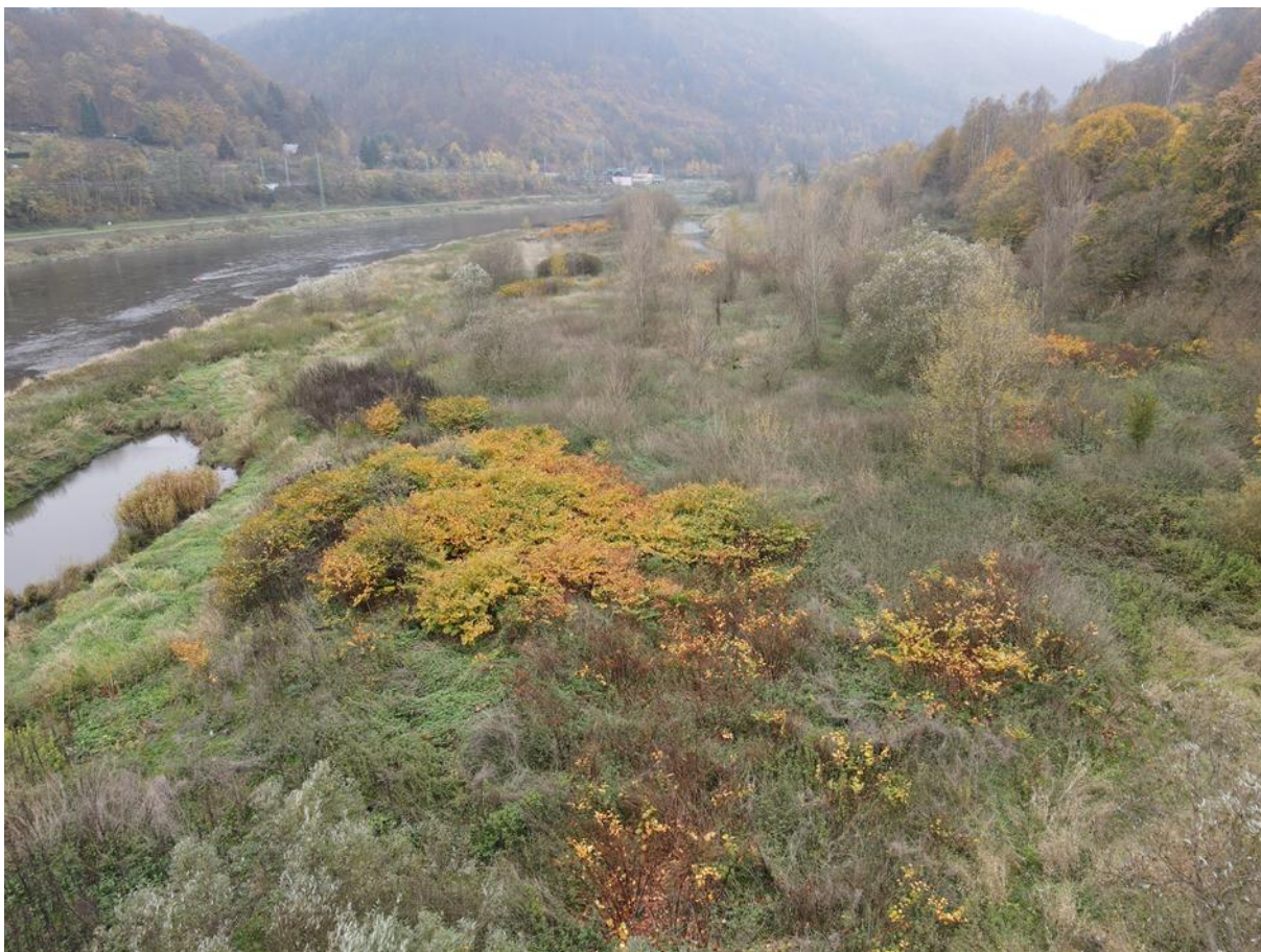
křídlatka viditelná jako rezavé porosty. v tomto případě se jedná o kombinaci střední a husté abundance. pro zřetelnost zákres v kopii obrázku (zákres jen polykormonů v popředí)