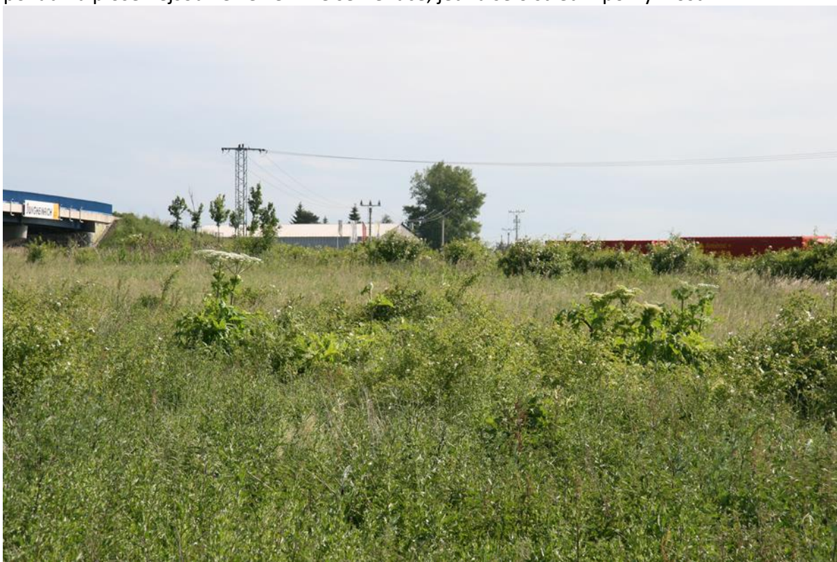
příklad střední pokryvnosti