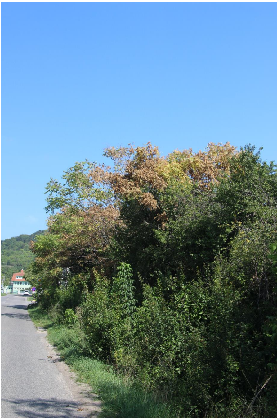
Viditelné odumírání dospělého stromu pajasanu po navrtání a aplikaci herbicidu.