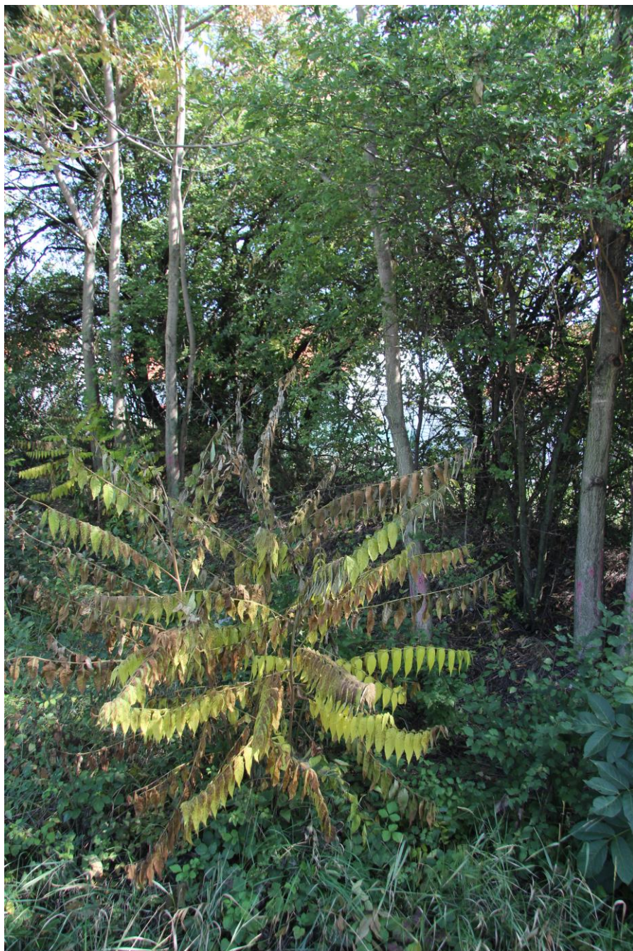
Ošetřený mladý jedinec pajasanu. Je vidět že dochází k odumření.