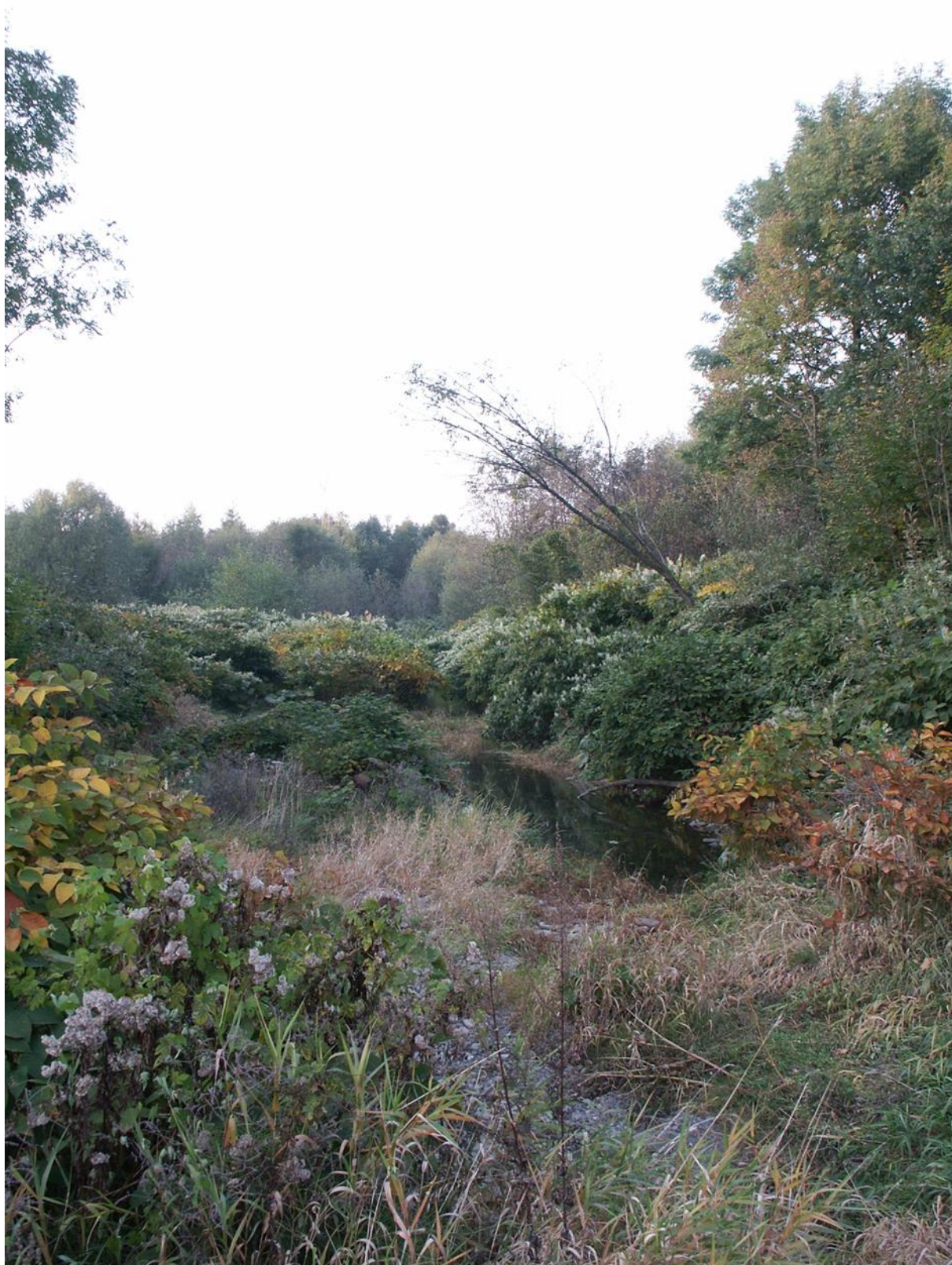
polykormony křídlatky s hustou abundancí