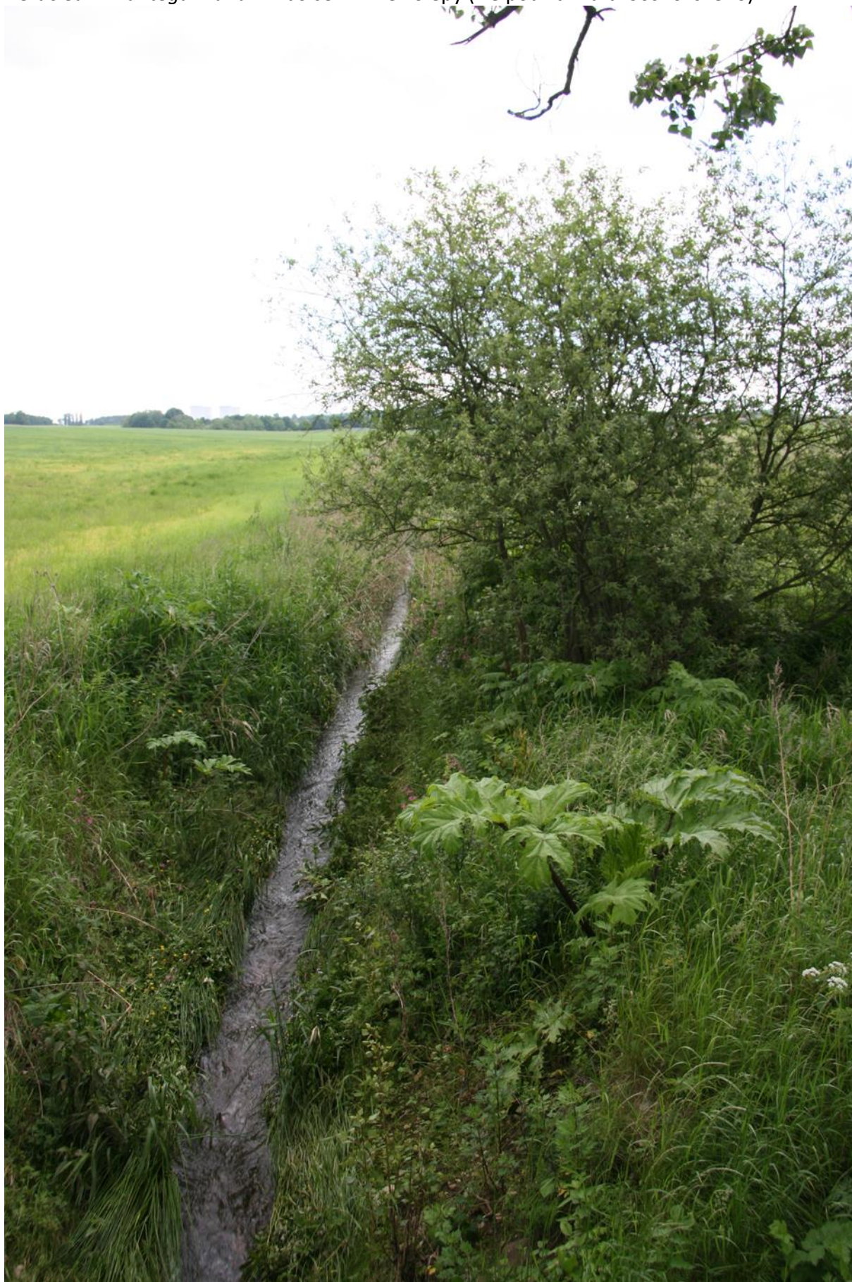
jednotlivé rostliny bolševníku

Heracleum mantegazzianum - bolševník velkolepý (lze použít i na b. Sosnovského)