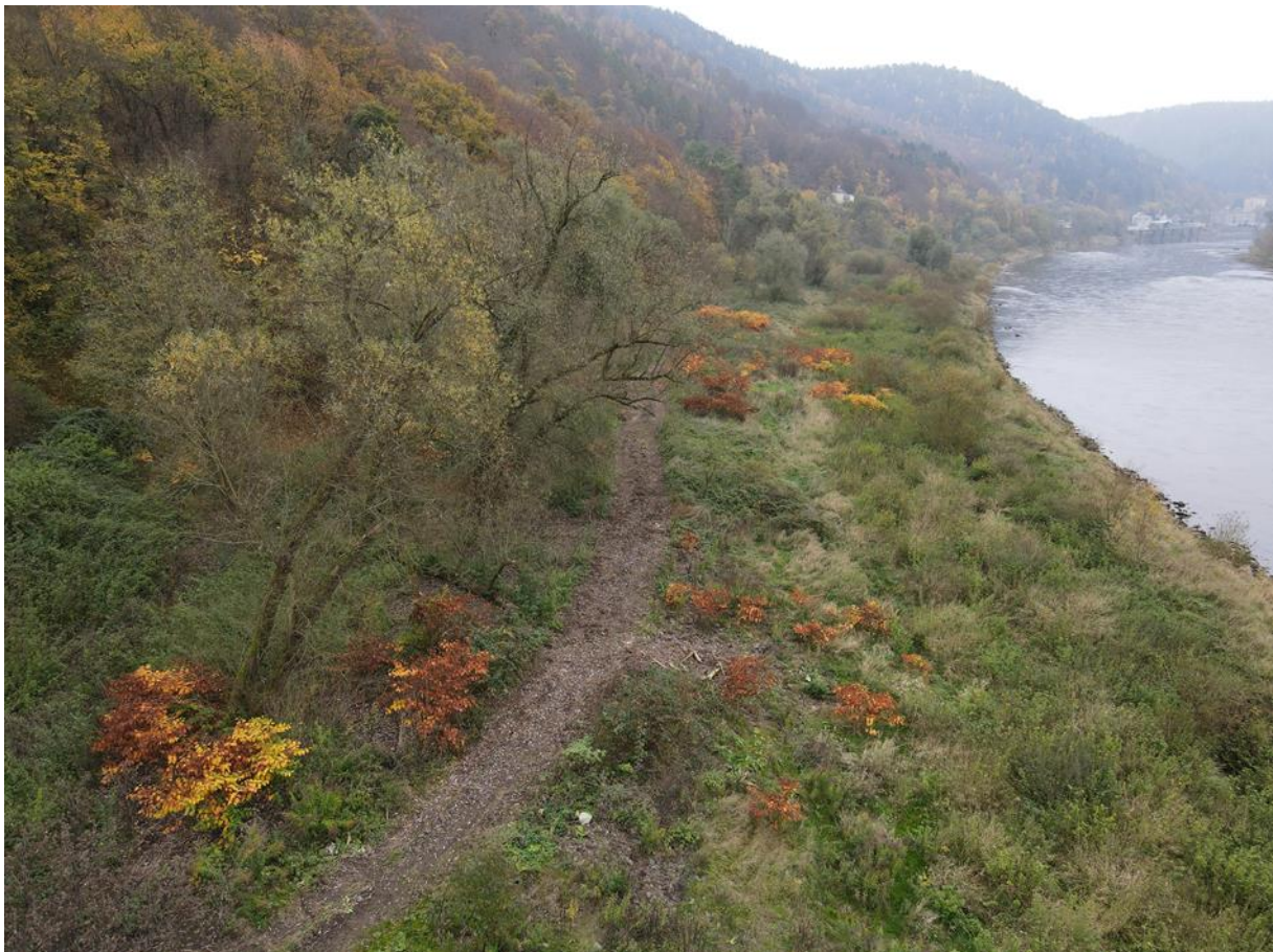
křídlatka viditelná jako rezavé porosty. v tomto případě se jedná o kombinaci střední a husté abundance. pro zřetelnost zákres v kopii obrázku (zákres jen polykormonů v popředí)