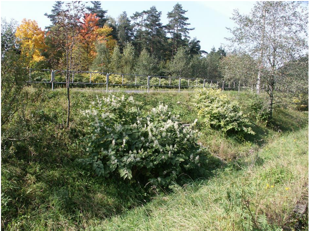
jednotlivé rostliny, příklad izolovaných a relativně malých polykormonů křídlatky