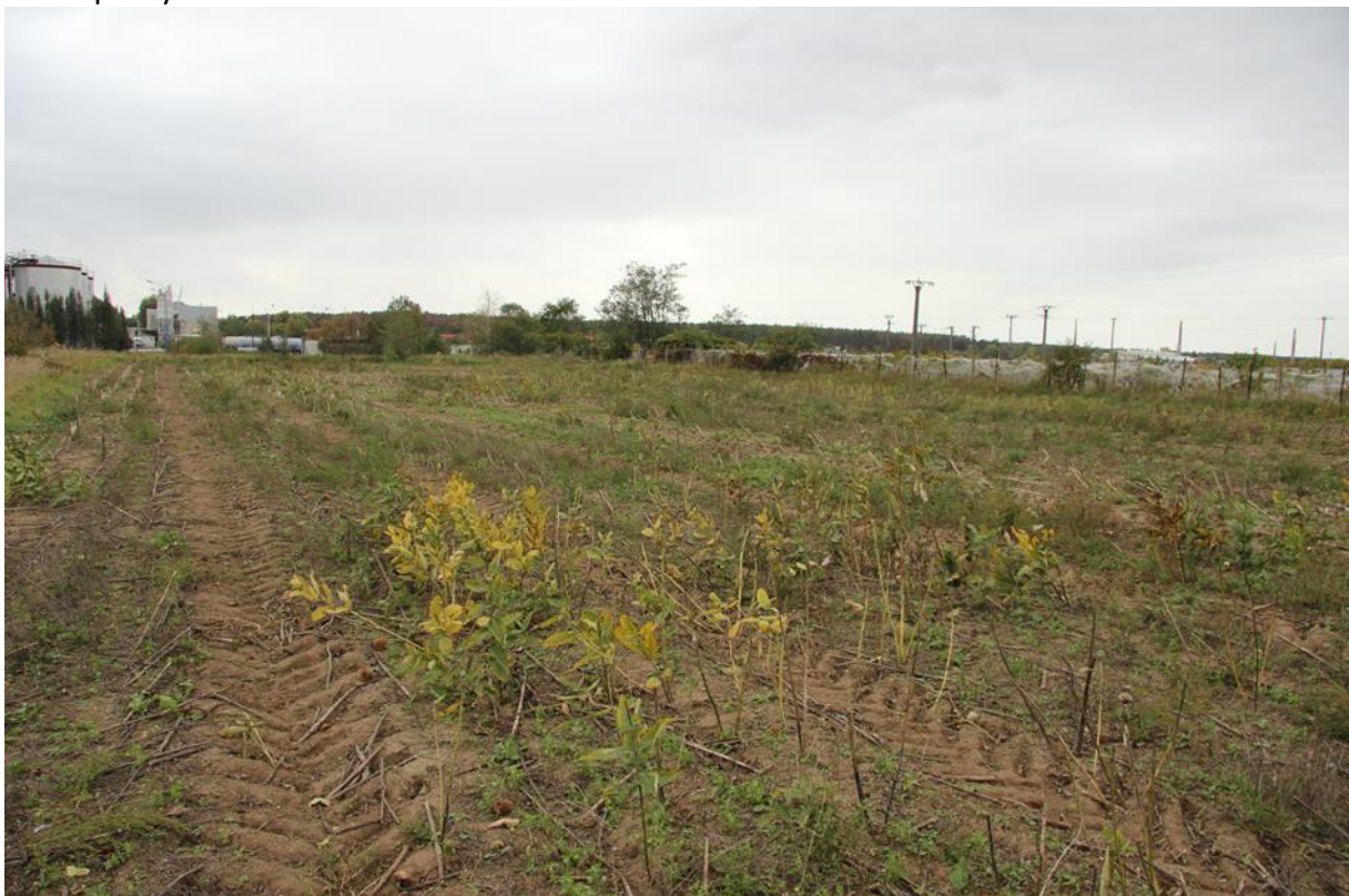
chybějící listy mohou značně ovlivnit vnímání hustoty porostu. zde se jedná o hustou pokryvnost