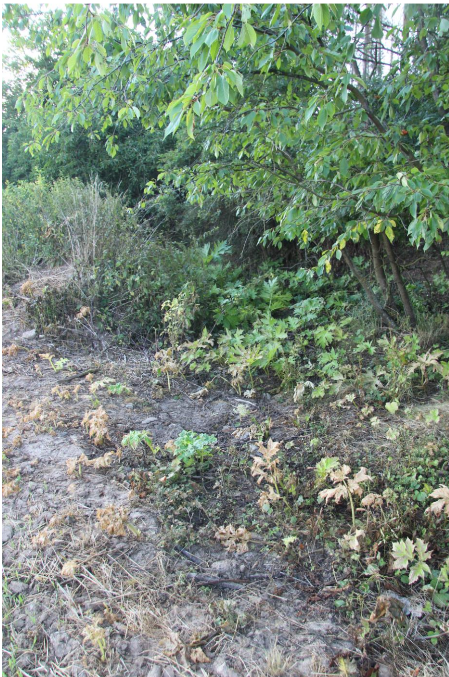
Postřikem nedostatečně ošetřená plocha s bolševníkem.