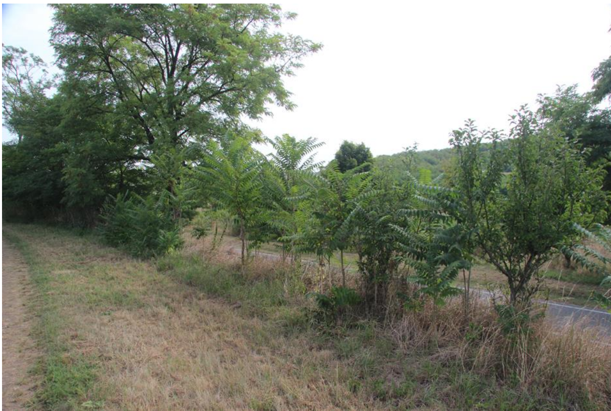
liniový porost pajasanu, střední hustota