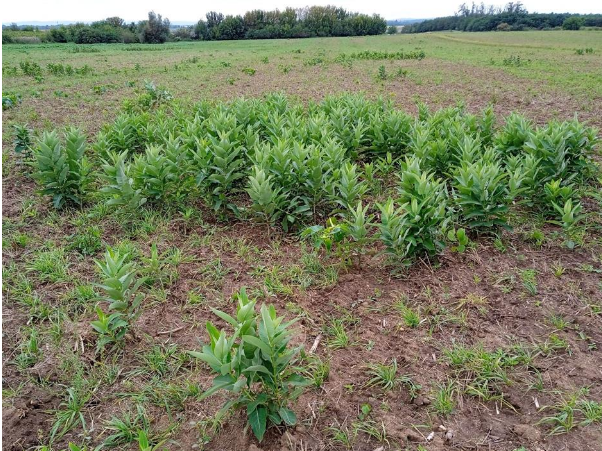
kombinace hustých porostů a střední pokrývnosti na poli