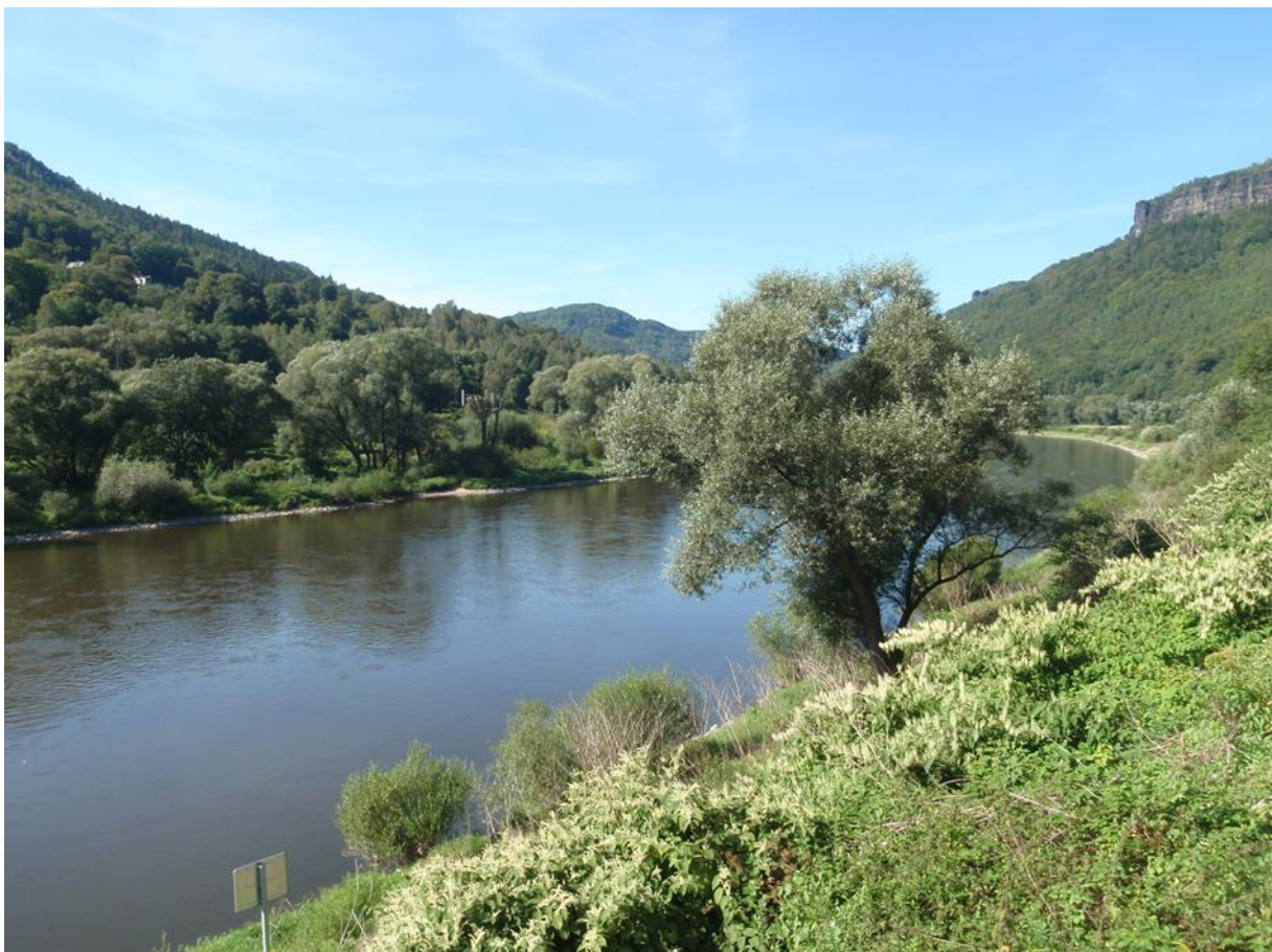
polykormony křídlatky s hustou abundancí