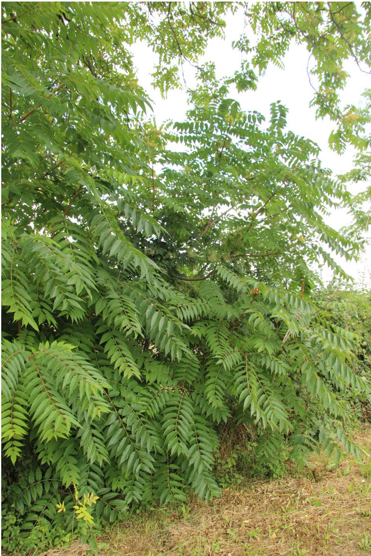
liniový porost pajasanu podél plotu, vzhledem k vysokému počtu semenáčků a výhonů se jedná o hustý porost